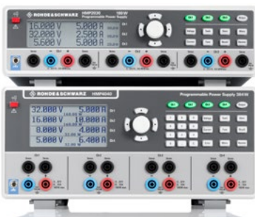
Трехканальный источник питания R&S ® HMP2030 и

четырёхканальный источник питания R&S ® HMP4040