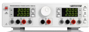
3-канальный функциональный источник питания