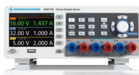
3-канальный источник питания