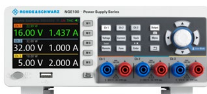
Вид R&S®NGE103B спереди