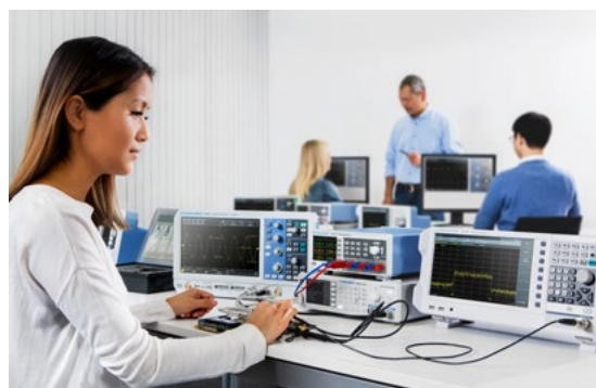
Адаптирован для использования в образовательных учреждениях, лабораториях и системах на базе стоек

Что бы ни произошло в процессе обучения неопытных пользователей навыкам практической работы с электроникой, источники питания серии R&S®NGE100B не получат повреждений от короткого замыкания, так как все выходы этих приборов защищены.