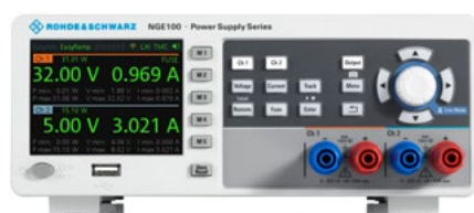
Вид R&S®NGE102B спереди