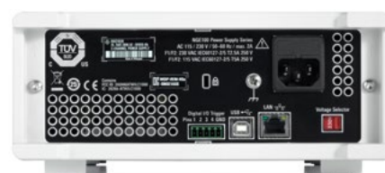
Серия R&S®NGE100B: вид сзади